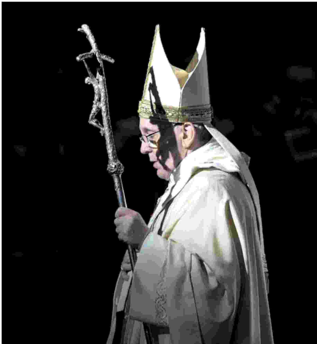
Papa Francesco durante una messa alla Basilica di San Pietro

Ritaglio stampa ad uso esclusivo del destinatario, non riproducibile.